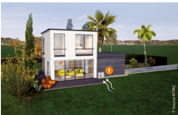
1 Pompe à Chaleur Air/Air ou Air/Eau. Prélèvement des calories dans l'air.

La chaleur prélevée dans l'air extérieur est transférée par la pompe à chaleur dans l'air ambiant du logement ou dans le circuit d'eau chaude de l'installation de chauffage. Suivant les modèles, la pompe à chaleur peut être installée à l'intérieur ou à l'extérieur du logement.